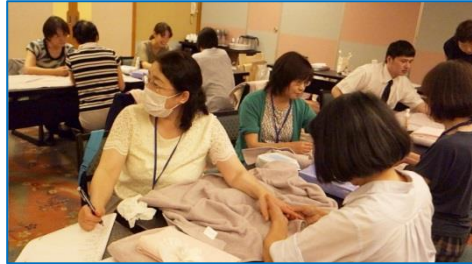
二人一組で、ハンドオイルマッサージの実技講習