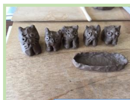
野焼き陶芸の作品