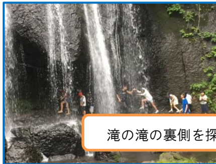
滝の滝の裏側を探検