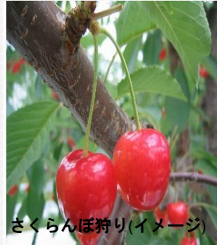
さくらんぼ狩り(イメージ)